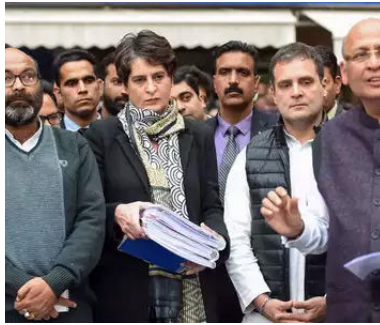
गौरतलब है कि सीएए/एनआरसी के खिलाफ चल रहे आंदोलनों पर उत्तर प्रदेश की

राष्ट्रीय मानवाधिकार आयोग ने उत्तर प्रदेश के मुख्य सचिव और पुलिस महानिदेशक को तलब करते हुए 6 सप्ताह के भीतर जवाब मांगा है। मानवाधिकार आयोग ने कांग्रेस महासचिव प्रियंका गांधी को पत्र भेजकर अवगत कराया है कि उनकी शिकायत पर कार्यवाही हो रही है।