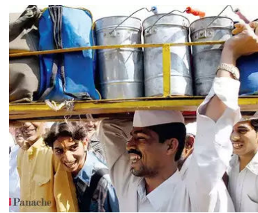
अधिकारी उपस्थित थे।

अजित पवार ने ट्वीट करके भी इस बारे में जानकारी दी है कि मंत्रालय में आयोजित एक बैठक में अधिकारियों को प्रधानमंत्री आवास योजना के तहत डब्बावालों को मकान उपलब्ध कराने के लिए आवश्यक कदम उठाने के निर्देश दिए गए हैं। इस बैठक में मुंबई डब्बावाला संघ के पदाधिकारी, श्रम मंत्री और दूसरे महत्वपूर्ण